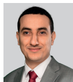
Ali Rabeh Maire de Trappes

A stylized handwritten signature in black ink, consisting of a long horizontal line with a vertical stroke and a small loop at the end, followed by the initials 'A.R.' in a cursive script.