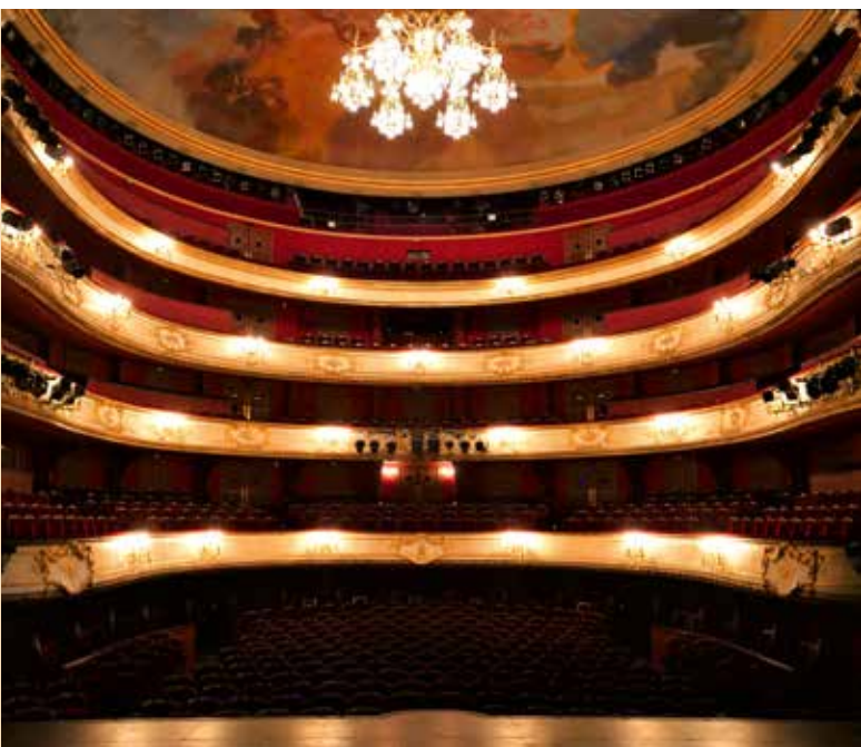
La Salle Richelieu de la Comédie-Française