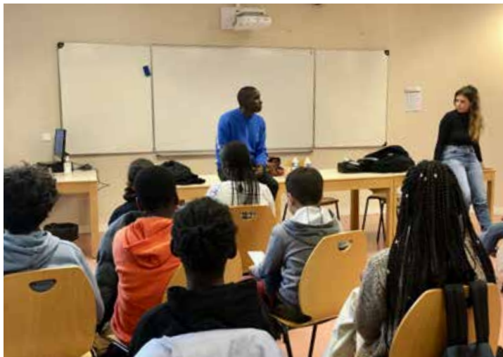
Les élèves de 6 e et 5 e du collège Le Village en présence de comédiens de la Comédie-Française