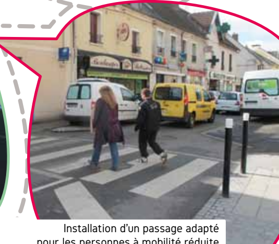
Installation d'un passage adapté pour les personnes à mobilité réduite rue Jean Jaurès devant le Cinéma le Grenier à Sel.