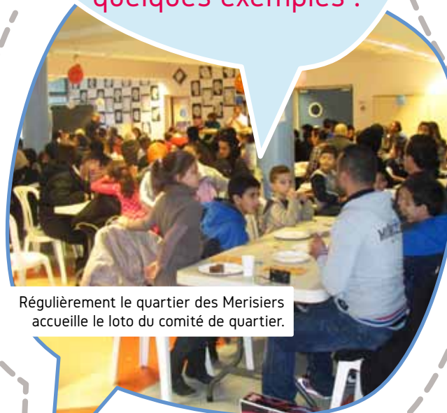
Régulièrement le quartier des Merisiers accueille le loto du comité de quartier.

De 2012 à 2015, près de 360 actions ont été organisées ou proposées par les comités de quartier, voici quelques exemples :