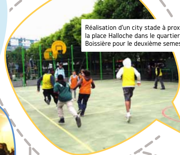
Réalisation d'un city stade à proximité de la place Halloche dans le quartier de la Boissière pour le deuxième semestre 2015.