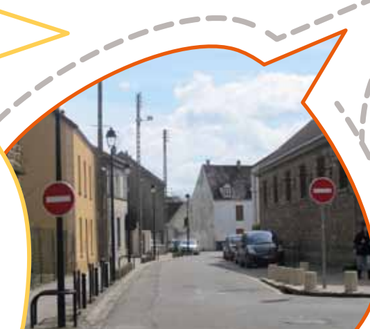
Changement de sens de circulation demandé en 2012 par le comité de quartier Cité Nouvelle.