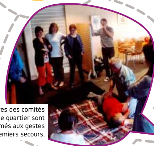
Les membres des comités de quartier sont formés aux gestes de premiers secours.