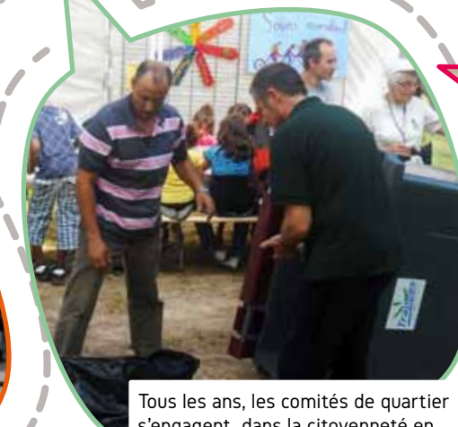
Tous les ans, les comités de quartier s'engagent dans la citoyenneté en nettoyant les quartiers comme sur la Plaine de Neauphle.